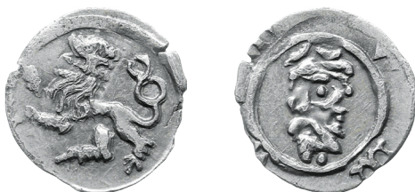
Il. 1. 4 Halerz b.d., miasto Wrocław, Kop. 8765a, Fbg 1887, nr 554, Fbg 1931, nr 99

Na awersie halerzy wrocławskich Zygmunta widnieje Lew czeski, natomiast na rewersie widnieje głowa św. Jana Chrzciciela oraz w otoku gotyckie litery M – W – M – W, tj. w dwukrotnie powtórzonym znaczeniu Moneta Wratislaviensis (il. 1). Kolejne tego typu odmiany halerzy wrocławskich z wizerunkiem czeskiego Lwa oraz św. Jana Chrzciciela charakteryzują się występowaniem na ich awersie oraz rewersie dodatkowych oznaczeń w postaci liter lub symboli, tj. oznaczeń kolejnych emisji 3 (il. 2).