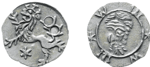
Il. 2. 5 Halerz b.d., miasto Wrocław, Kop. 8765h, Fbg 1887, nr 554c, Fbg 1931, nr 100c