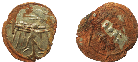
Il. 6. 16 Halerz b.d., miasto Wrocław, Kop. –, Fbg. 555b

jej wybicia (możliwe przecież, iż nawet więcej niż zaprezentowane przez autorów ich dwie pary) może potwierdzać emisję tej monety na większą skalę.