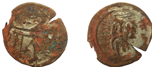
Il. 4. 14 Halerz b.d., miasto Wrocław, Kop. 8766, Fbg 1887, nr 555