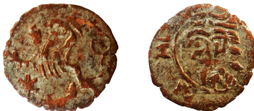
Il. 7. 17 Fałszerstwo z epoki wrocławskiego halerza Zygmunta Luksemburskiego

Na zakończenie należy jednak podkreślić, iż analizując pochodzenie opisanych powyżej „miedzianych” halerzy z orłem dolnośląskim na awersie i głową św. Jana na rewersie nie można wykluczyć jeszcze jednej, bardzo prawdopodobnej tezy, a mianowicie, iż mamy do czynienia w tym przypadku wyłącznie z fałszerstwami, które spotykamy także wśród średniowiecznych śląskich halerzy i brakteatów halerzowych. Znane fałszerstwa z tego okresu, to np. brakteaty świdnickie z głową dzika (jak Kop. 8697), czy też halerze legnickie ze św. Piotrem (jak Kop. 8656). Wśród fałszerstw „z epoki” znaleźć również można wrocławskie halerze typu Rempel (il. 7-9).