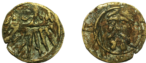
Il. 5. 15 Halercz b.d., miasto Wrocław, Kop. –, Fbg 1887, nr 555b

Autorom udało się również pozyskać odmianę halercza odnotowaną przez F. Friedensburga jako poz. 555b, a już nie notowaną przez E. Kopiciego, z charakterystycznym krzyżem św. Andrzeja (il. 5).