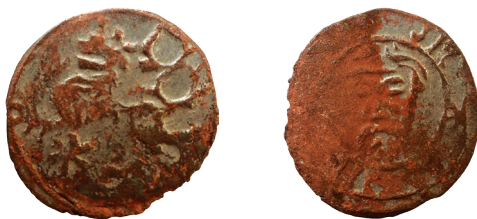
Il. 9. 19 Falszerstwo z epoki wrocławskiego halerza Zygmunta Luksemburskiego

Podobieństwo zilustrowanych powyżej fałszerstw halerzy wrocławskich Zygmunta Luksemburskiego do halerzy z orłem na awersie i głową św. Jana na rewersie zdaje się być niezaprzeczalne. Skoro więc nie można mieć wątpliwości co do proveniencji tych pierwszych, to także – przy braku jednoznacznych materiałów źródłowych na temat emisji przez Wrocław tego typu monety – należy dopuścić, iż fałszerstwami z epoki mogą być także opisanie w niniejszym artykule odmiany miedzianych halerzy wrocławskich z orłem dolnośląskim na awersie.