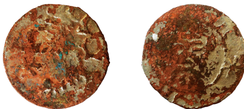
Il. 8. 18 Fałszerstwo z epoki wrocławskiego halerza Zygmunta Luksemburskiego