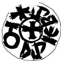
Il. 5. Rekonstrukcja awersu monet Jerzego Narymuntowicza (rys. Borys Paszkiewicz), skala 2:1

Figura z rewersu może być monogramem lub tamgą. Stosunkowo cienkie linie wskazują, że nie mamy do czynienia z pojedynczą literą, na przykład L lub F, bo te zapisywano wówczas inaczej. Nie ma też możliwości interpretacji naszego znaku jako ligatury dwu lub więcej liter. Widoczna na jednym egzemplarzu kulka wypada mniej więcej w środku stempla i może być znakiem pomocniczym rytownika, choć zazwyczaj takie środkowe kropki są znacznie mniejsze. Nie należałyby wtedy do figury. Tę zaś można interpretować jako przypuszczalną tamgę – wyjątkowo prostą i nieznaną skądinąd, przypominającą fragment Słupów Giedymina. Zwraca wszakże uwagę, że figury z poziomych linii z zatkniętymi na nich liniami pionowymi, rozszczepionymi na wierzchołkach, znajdujemy na anonimowych naśladownictwach dangów tatarskich Dżani bega z Gulistanu z lat 752 lub 753 Hidżry (1351-1353) (typ I Kozubowskiego). Są to monety znane między innymi ze skarbu z Borszczowa i przypisywane przez Konstantina Chromowa księciu kijowskiemu Teodorowi w latach 1354-1363. Gdyby nasza moneta miała odwoływać się do tego wzorca, byłoby to skrajne uproszczenie imitacji arabskiego napisu. Nie doszliśmy zatem do jasnej interpretacji, być może dlatego, że nie znamy całości analizowanego obrazu.