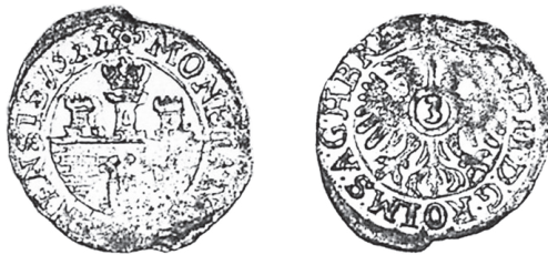
Il. 5. 3-krajarówka (grosz) gubińska, 1622 r. Źródło: B. Pilz, Museumsminiaturen , s. 102. Średnica 17-18 mm, waga 0,69 g

Rv.: orzeł dwugłowy, na piersi jabłko cesarskie z cyfrą 3 (powyżej nieczytelna korona?). W otoku [FE]RD IID:G RO IM.S.A.G.H.B REX 86 .