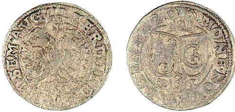
Il. 4. 3-krajarówka (grosz) gubińska, 1622 r. Źródło: Muzeum Narodowe w Poznaniu, nr ew. MNP GN B 7018. Średnica 18 mm, waga 0,84 g

niezasadne. Zresztą pod wątpliwość fakt jego istnienia poddawał już E. Bahrfeldt 83 . Fenigi i grosze przypisane mennicy gubińskiej do złudzenia przypominają wyroby pochodzące ze wspomnianej Getyngi. Były one wytwarzane kilka lat przed gubińskimi. Monety z legendą MONETA GVBENENSIS są wielkim rarytasem, rzadko pojawiającym się w obrocie. W ostatnim czasie nie odnotowały ich największe katalogi aukcyjne 84 . Jeden z egzemplarzy 3-krajarówki znajduje się w zbiorach Gabinetu Numizmatycznego Muzeum Narodowego w Poznaniu (il. 4) 85 . W napisie awersu zamiast GVBEN umieszczono ARGEN. Stanisław Suchodolski zwracał uwagę, że mimo opisywania monet w wielu publikacjach, nie podawano ich podobizn i nie występowały w zbiorach Staatliche Museen w Berlinie oraz Staatliche Kunstsammlungen w Dreźnie.