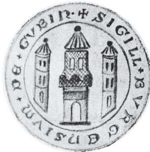
Il.2. Pieczęć miasta z roku 1312. Średnica ok. 26 mm

Nie zmienia to jednak faktu, że był to czas, kiedy na Łużycach produkowano znaczną ilość monet, jednak do dnia dzisiejszego wiele problemów nastęrcza ich właściwe przypisanie. Brakteaty te były większe i bardziej prymitywne od analogicznie bitych