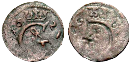
Il. 8. Fenig gubiński, 1621 r., ze znakiem feniga wewnątrz litery G. Waga 0,18 g

Rv.: jabłko cesarskie z liczbą 24 w środku. W otoku FERD·II·D·G·R·I·S·A·G·H·B·R· (10 odmian literowych i interpunkcyjnych) 91 .