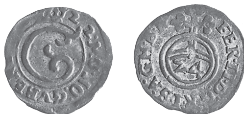
Il. 7. 3-krajarówka (grosz) gubińska, 1622 r. Źródło: Muzeum Narodowe w Warszawie, nr ew. NPO 62183. Średnica 16,3 mm, waga 0,78 g 88

Znanych jest 16 odmian gubińskich fenigów z pierwszego roku działalności mennicy (il. 8), dwie odmiany z roku 1622 i jedna bez daty. Ponadto cztery główne typy 3-krajarówek (w tym jedna odnaleziona w Poznaniu) 89 . Z roku 1622 pochodzi również 10 typów groszy. Głównym wątkiem legendy fenigów jest ukoronowana litera G oraz data lub jej brak. 3-krajarówki (grosze) E. Bahrfeldt pogrupował na następujące 4 rodzaje: