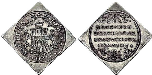
Il. 9. Klipa gubińska, 1623 r. Wymiary 44x43 mm, waga 29,12 g

Nie udało się ustalić właściciela inicjałów, chociaż pewną wskazówką jest tutaj herb 96 . Jego symbolika może wskazywać, że jest to albo herb, który został nadany mieszczaninowi, albo gmerk 97 .